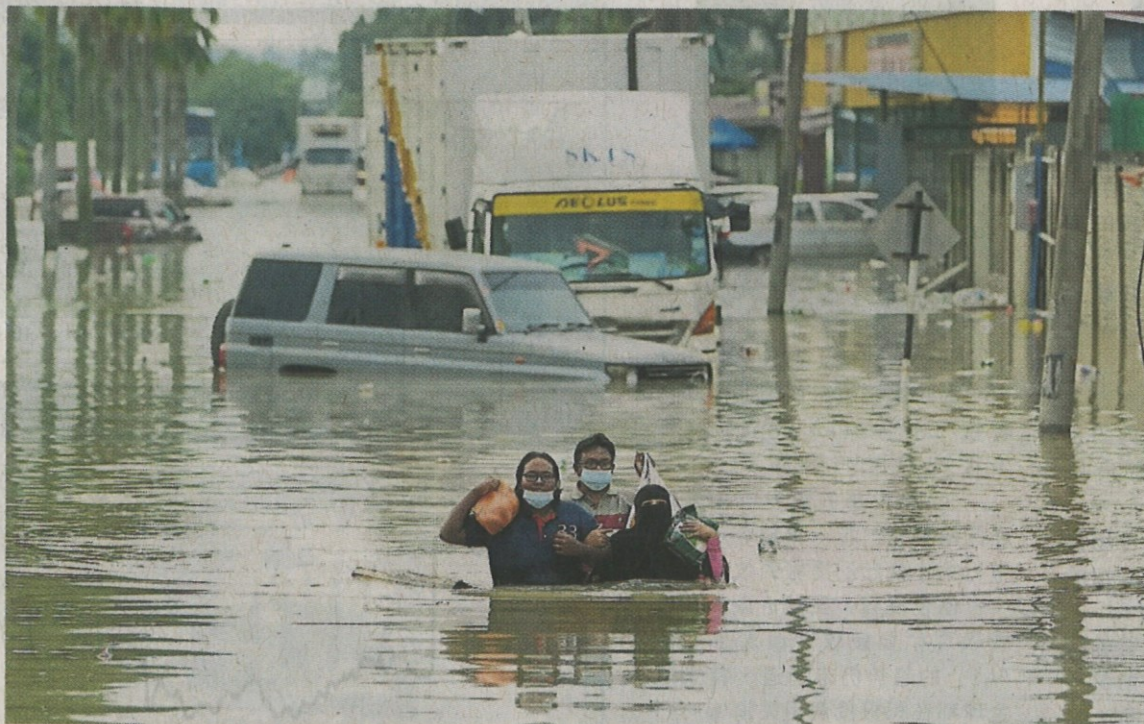
气候危机不再是未来的问题，而是重新塑造了当今世界。

一些上市公司表现出令人印象深刻的气候战略与业务目标的一致性。例如，一家上市公司将气候风险，纳入其企业风险管理框架，确保其在董事部讨论中占据突出地位。