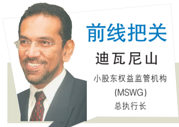
前线把关 迪瓦尼山 小股东权益监管机构 (MSWG) 总执行长

逆向投资者的特点是愿意逆流而上。他们对自己的分析有坚定的信念，愿意承受短期的市场波动。在其他大多数投资者倾向