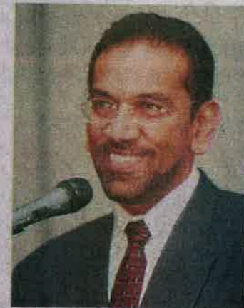
迪瓦尼山：应该采用混合式股东大会。

尽管实体大会能够免去各种线上大会的弊端，但来自偏远地区的股东，仍难以参加实体大会，因此，若上市公司能同时举办线上和实体大会，则可解决该问题。