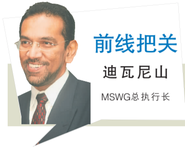
前线把关 迪瓦尼山 MSWG总执行长

公司管理层（包括执行主席/执行董事、总执行长和财务总监等）接洽，以解决和财务报表相关的问题。